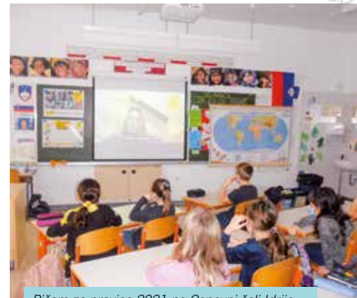
Pišem za pravice 2021 na Osnovni šoli Idrija.

Pogosto se tudi res spremeni oz. izboljša njihova situacija: odpravijo se obtožbe, z njimi zaporniške oblasti ravnajo manj grdo, spremenijo se zakoni itd.